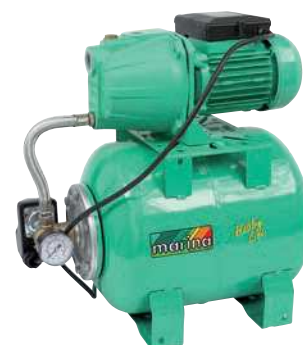
CAM 40/22 HL

P1 800 watt Q max. 50 l/min 1,4 ÷ 2,8 bar