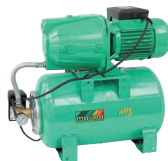
CAM 100/25 HL

P1 800 watt Q max. 50 l/min 1,4 ÷ 2,8 bar