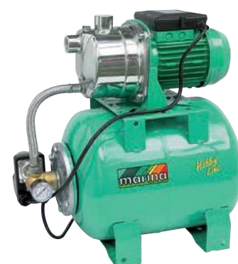
CAM 80/22 HL

P1 800 watt Q max. 50 l/min 1,4 ÷ 2,8 bar