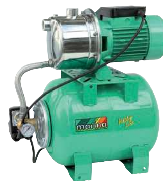
CAM 88/22 HL

P1 800 watt Q max. 50 l/min 1,4 ÷ 2,8 bar